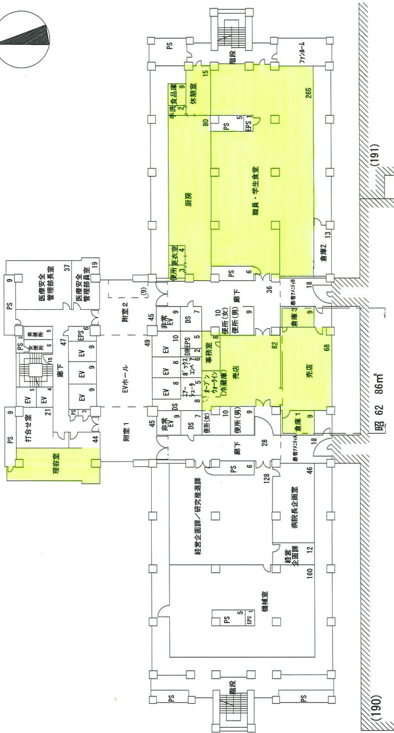
千葉大学医学部附属病院 にし棟 3階平面図